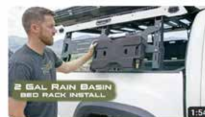
Rain Basin 2 | Bed Rack Install