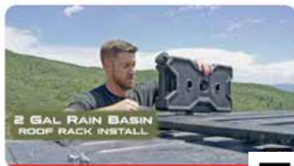
Rain Basin 2 | Roof Rack