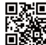
Rain Basin | Roof Rack Install