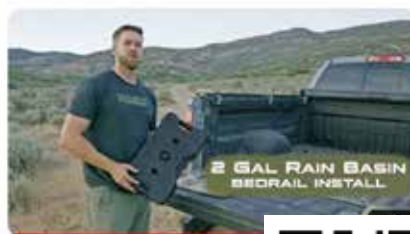
Rain Basin 2 | Bedrail Install