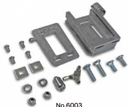
No.6003 ¥15,000 (税込 ¥16,500)

この3つの鍵を全て無くすと、鍵穴を壊さなければ、取り外すことができなくなりますのでご注意ください。